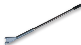
222219.900 Universal dækselnøgle